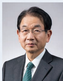
Representative Director, Chairman and CEO

我们以“Together with our global partners, we bring innovation to everyone everywhere”为使命，作为合作伙伴，服务于在前沿领域需要凭借独家尖端SoC实现新服务和新产品差异化的客户，同时在日新月异的半导体生态系统中与提供最新技术的供应商展开积极协作，为客户及全球最终用户创造全新价值，助力实现社会繁荣。