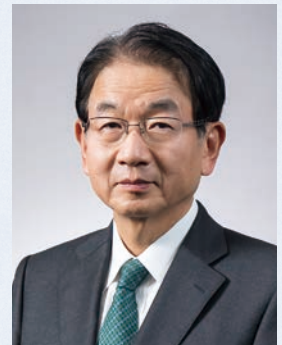
Representative Director, Chairman and CEO

Socionext是一家秉持独家“Solution SoC”商业模式，面向全球市场致力于开发和提供定制化SoC（系统级芯片）的无晶圆厂半导体企业。我们以“Together with our global partners, we bring innovation to everyone everywhere”为使命，作为合作伙伴，服务于在前沿领域需要凭借独家尖端SoC实现新服务和新产品差异化的客户，同时在日新月异的半导体生态系统中与提供最新技术的供应商展开积极协作，为客户及全球最终用户创造全新价值，助力实现社会繁荣。