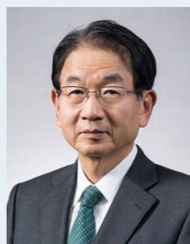
Representative Director, Chairman and CEO

我们以“Together with our global partners, we bring innovation to everyone everywhere”为使命，作为合作伙伴，服务于在前沿领域需要凭借独家尖端SoC实现新服务和新产品差异化的客户，同时在日新月异的半导体生态系统中与提供最新技术的供应商展开积极协作，为客户及全球最终用户创造全新价值，助力实现社会繁荣。