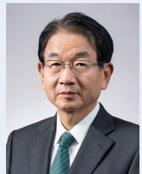
Representative Director, Chairman and CEO

Socionext是一家秉持独家“Solution SoC”商业模式，面向全球市场致力于开发和提供定制化SoC（系统级芯片）的无晶圆厂半导体企业。我们以“Together with our global partners, we bring innovation to everyone everywhere”为使命，作为合作伙伴，服务于在前沿领域需要凭借独家尖端SoC实现新服务和新产品差异化的客户，同时在日新月异的半导体生态系统中与提供最新技术的供应商展开积极协作，为客户及全球最终用户创造全新价值，助力实现社会繁荣。