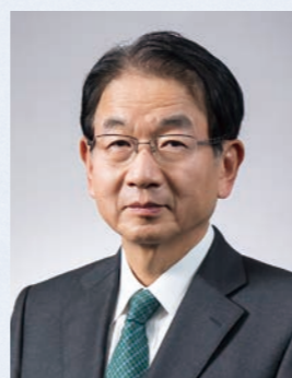
Representative Director, Chairman and CEO

我们以“Together with our global partners, we bring innovation to everyone everywhere”为使命，作为合作伙伴，服务于在前沿领域需要凭借独家尖端SoC实现新服务和新产品差异化的客户，同时在日新月异的半导体生态系统中与提供最新技术的供应商展开积极协作，为客户及全球最终用户创造全新价值，助力实现社会繁荣。