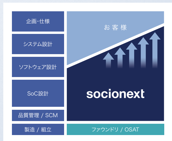
ソシオネクストの“Solution SoC”

こうしたお客様ニーズや市場環境の変化に応えるため、ソシオネクストは、お客様のコンセプト段階から関与し、エコシステムの最適な組み合わせを提案することで、差別化SoCを実現する“Solution SoC”カンパニーを目指します。それは、論理合成や物理設計に注力する従来型ASICとは付加価値を異にするソシオネクストならではのユニークなビジネスモデルです。