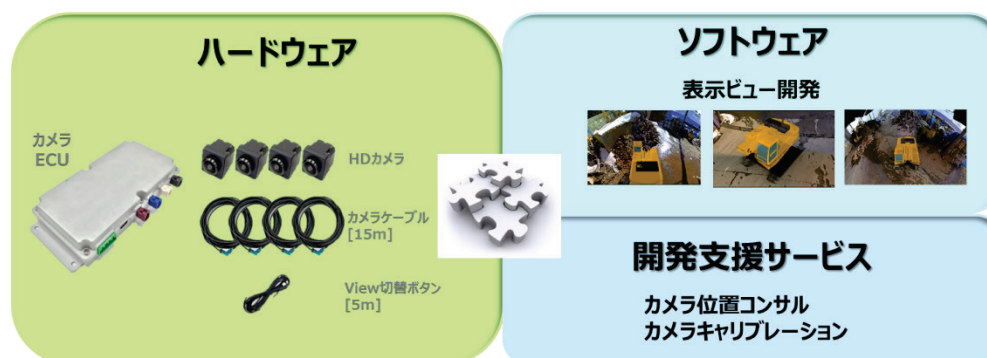
図2 全周囲立体モニタシステム評価ソリューション システム構成 (クリックで拡大)

当社はこのたび、全周囲立体モニタシステムの評価および導入に必要なハードウェア、ソフトウェアと開発支援サービスをパッケージにした「全周囲立体モニタシステム評価ソリューション」の提供を開始しました。本ソリューションの提供により、カメラ取り付け位置の最適化から用途に応じた映像合成および表示のチューニングなど、必要な評価を当社が一括して実施することで、より短期間に評価が終了するだけでなく、当社のハードウェア、ソフトウェアを購入する必要のない車両メーカーにおいても当モニタシステムの採用検討を容易に実施することが可能になります。また、車載用途だけでなく、ドローンによる空撮映像への適用など、「全周囲立体モニタシステム」の利点を活かした様々な視覚補助システムの普及が加速することを期待しています。