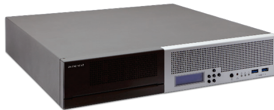
写真: ストリーミングエンコーダー「e8」 クリックで拡大

「e8」は、ソシオネクスト製マルチチャンネル・リアルタイムエンコーダーSoC「MB86M31」を搭載、8K/60p 映像の HEVC/H.265 エンコードをリアルタイムで処理することで、高精細・大容量映像の IP ネットワーク経由でのライブストリーミングを可能にします。プロフェッショナルな映像撮影現場で必要とされる高品位な 4:2:2 10 ビットカラープロファイルをサポート、臨場感の高い映像の配信を実現しています。