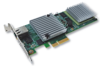
M820L メディアアクセラレーターカード

「M820L」は、映像データ処理サーバーに装着することでシステムの構成や設定を変更することなくコーデック処理の速度を向上できる「メディアアクセラレーター」です。当社は本日、このM820Lで8Kのエンコード処理を可能にする「M820L-8K」オプションの提供を開始しました。M820L-8Kにはファームウェアのアップデートとエンコードのライセンスが含まれ、このオプションによりユーザーは高画質な8K映像のエンコード処理を容易にかつ高速に実行することができ、映像制作の作業効率が劇的に向上します。