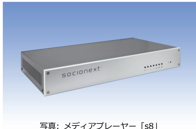
写真: メディアプレーヤー「s8」